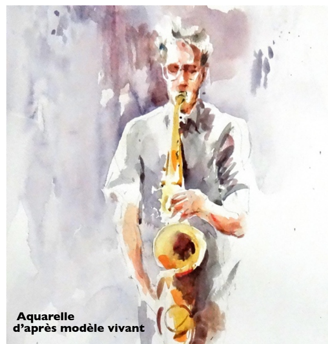
Aquarelle d'après modèle vivant